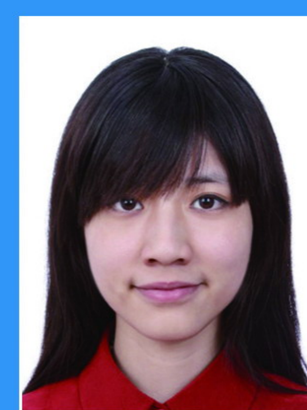
头发遮挡眉毛 眼睛或耳朵