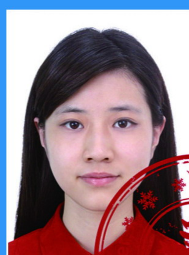
印章或其 他物遮挡人像