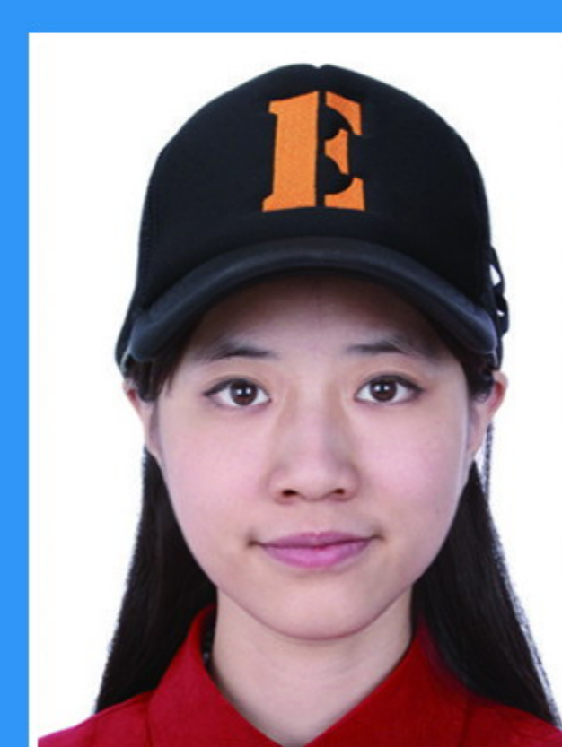
带帽、发饰 遮挡面部、耳朵