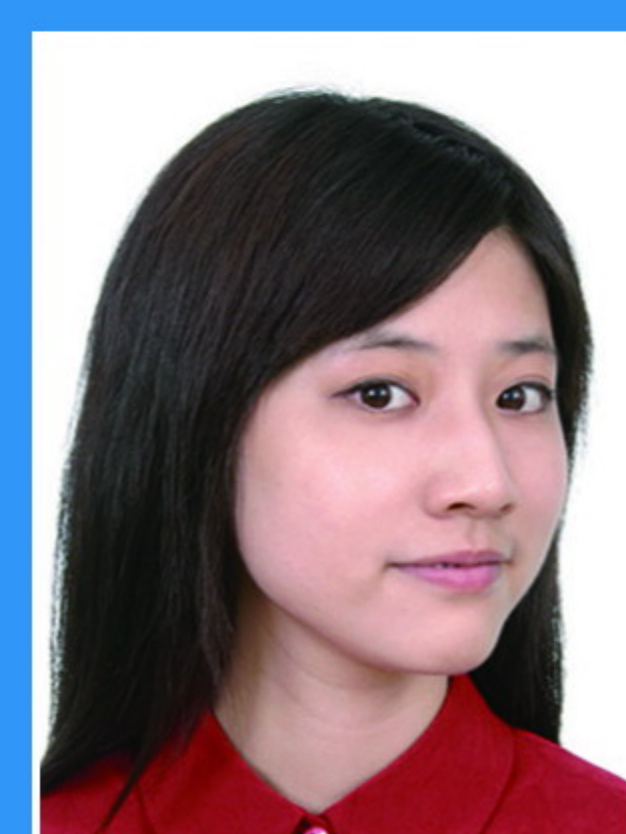
头部侧向一边 或未正视镜头